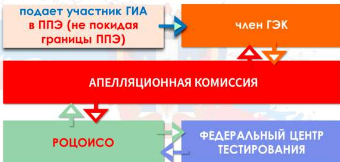
СХЕМА РАССМОТРЕНИЯ АПЕЛЛЯЦИИ О НАРУШЕНИИ ПОРЯДКА

Срок подачи - в день проведения экзамена по соответствующему учебному предмету, не покидая ППЭ.